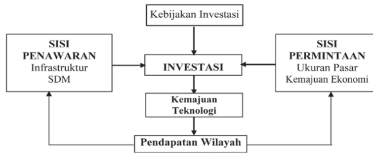
Gambar 2. Determinan Investasi dan Kaitannya dengan Pembangunan Wilayah

Bila dirumuskan secara empirik untuk kasus Indonesia, faktor-faktor yang mempengaruhi dari sisi suplai adalah infrastruktur dan kualitas sumberdaya manusia (pendidikan). Dari sisi permintaan, ukuran pasar (PDRB) dan tingkat kemajuan ekonomi suatu wilayah (pangsa pertanian terhadap PDRB dan keterbukaan perdagangan) akan mempengaruhi arus investasi yang masuk. Masing-masing faktor tersebut sudah diamati secara terpisah dalam berbagai studi di negara lain seperti oleh Kumar and Chadee (2002), Cheng dan Kwan (2000), Demurger (2001), Globerman (2002) dan Guimaraes (2000). Untuk membuktikan hal ini dilakukan pengujian dengan menggunakan model data panel dinamik seperti pada kasus konvergensi, untuk keseluruhan faktor secara simultan. Hasil estimasi dengan Sys-GMM menunjukkan koefisien lag dari variabel dependen yang tidak bias karena berada di antara estimator OLS dan fixed-effects model . Bila diurutkan berdasarkan besarnya pengaruh berbagai faktor terhadap arus investasi ke suatu wilayah, diperoleh hasil secara dari yang terbesar: (1) ukuran pasar; (2) tingkat kemajuan ekonomi; (3) infrastruktur dan (4) kualitas